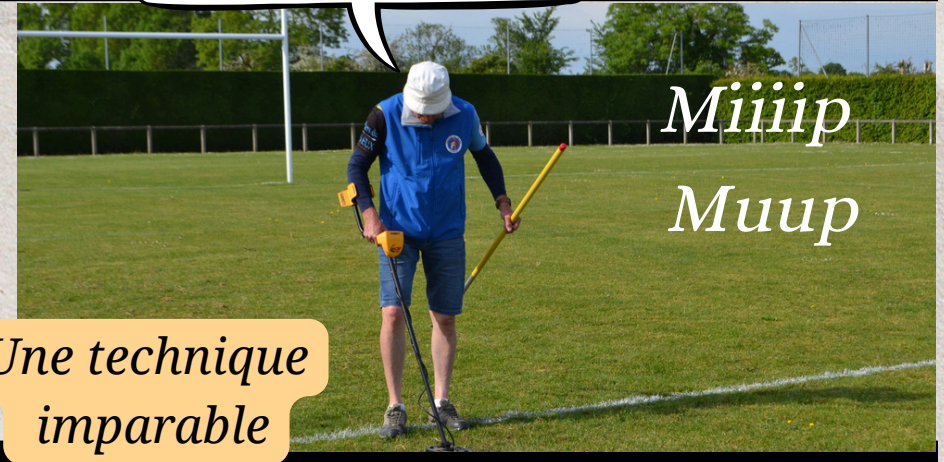
Une technique imparable

La prod' a un gros budget. C'est le modèle ZeeZee Top. Un bijou !