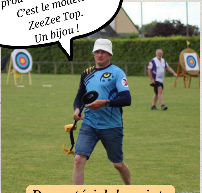
Du matériel de pointe

La prod' a un gros budget. C'est le modèle ZeeZee Top. Un bijou !