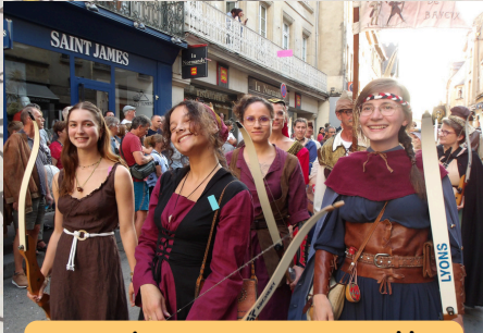
Quand on arrive en ville, les passants se rangent sur le trottoir!