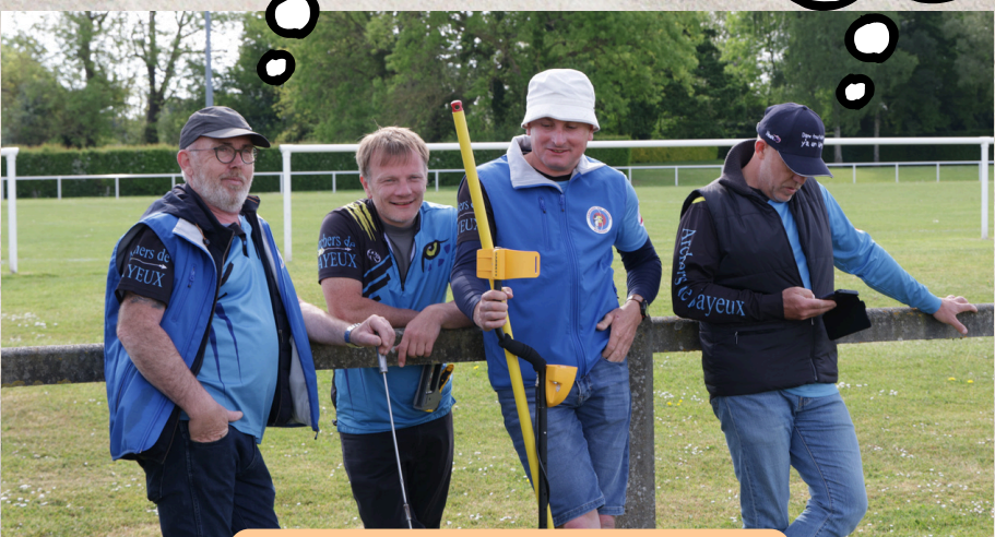
Une équipe au taquet

On approche du but ! Z'entendez ce petit bruit?!