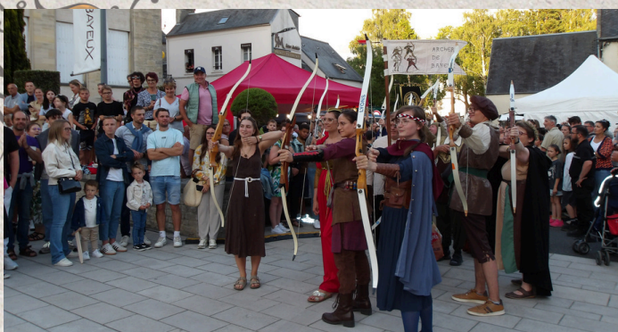
La Compagnie en action, place de la mairie