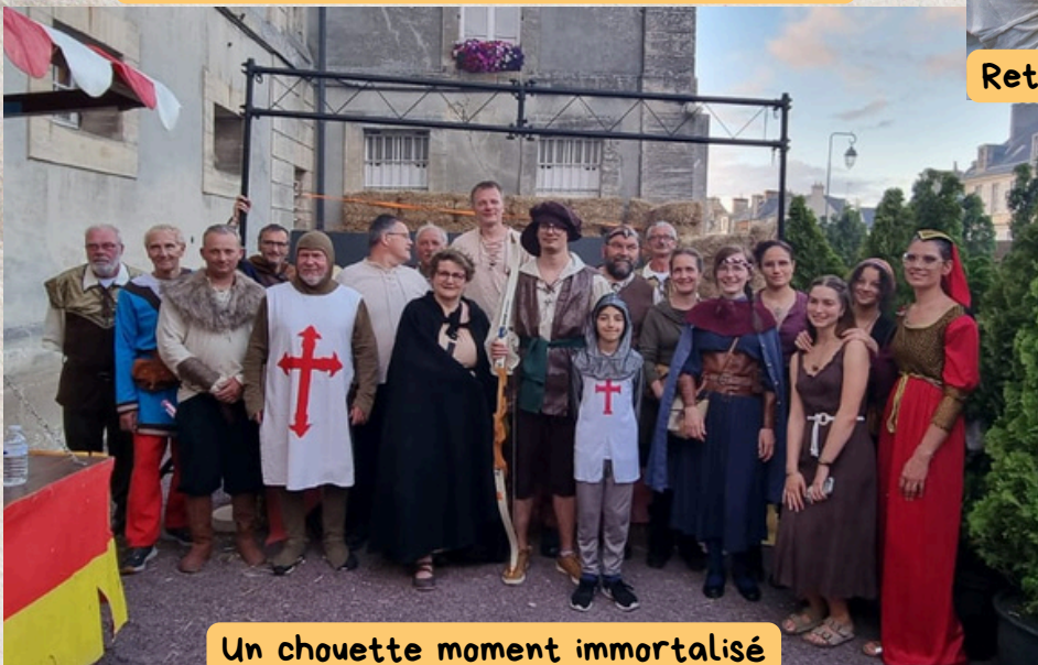
Un chouette moment immortalisé