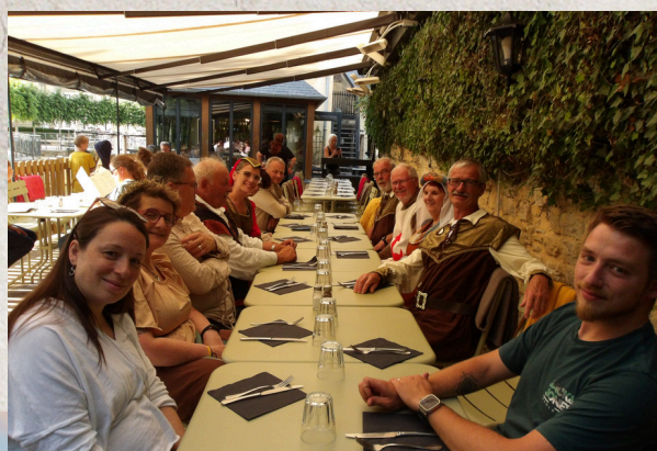
Retrouvailles au Moulin de la Galette