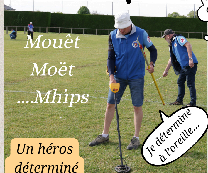
Un héros déterminé